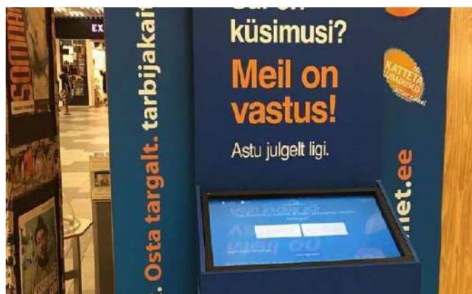
Tarbijakaitseameti infokiosk kaubanduskeskuses

Tarbijakaitseamet avas 2015. aastal Tallinna lennujaamas kolm infokioskit, kust reisija leiab reisimisega seonduvat infot oma õiguste kohta erinevates olukordades. Samuti on reisijail infokioski vahendusel võimalik kirjalikult pöörduda Tarbijakaitseameti poole.