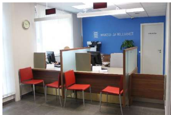
MTA teeninduslett Haapsalus

MTAs vähenes näost-näku kliendikontaktide arv märkimisväärselt uute e-teenuste kasutuselevõtu järgselt. Seejärel on olukord stabiliseerunud ja viimastel aastatel on teenindusbüroo külastatavus vähenenud keskmiselt 4-6,5% aastas. 2017. aastal vähenes külastatavus 11,6% võrra (vt tabel 4). Teeninduskoormus büroodes on oluliselt suurem tuludeklaratsiooni esitamise perioodil veebruarist-aprillini, millal võivad tekkida järjekorrad.