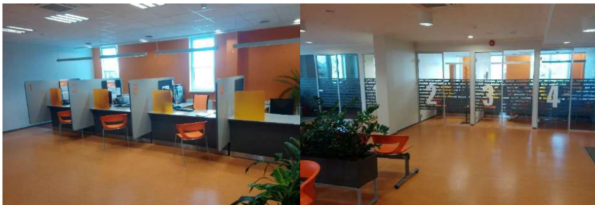
Töötukassa teeninduslett ja mõned vestlusruumid Põlvas

Töötukassa spetsiifika seisneb selles, et paljud kliendid peavad kuni töö leidmiseni regulaarselt käima asutuse teenindusbüroos. Kliente nõustavad töövahenduskonsultandid teenindusletis ja juhtumikorraldajad vestlusruumis. Töövahenduskonsultant nõustab inimesi, kelle eeldused tööle saada on suuremad ning ühe kliendi kohtumine kestab ligikaudu 15 minutit. Juhtumikorraldajad tegelevad suuremat privaatsust ja põhjalikumat nõustamist vajavate klientidega, kelle nõustamiseks kulub rohkem aega ca 30-45 minutit nõustamiskorra kohta. Nõustamise eesmärk on klientide tööle saamisele kaasa aidata. Igal juhtumikorraldajal on oma vestlusruum, mis on ühtlasi ka tema töökoht. Töötukassa esinduste ruumid on paigutatud ja kujundatud selliselt, et need toetaksid funktsionaalselt klientide nõustamist ja neile teenuste osutamist. Näiteks on kõigile inimestele avatud karjäärinõustamise ja karjääriinfo ala, nõustamisala jaguneb kolmeks vastavalt erinevate kliendirühmade vajadustele (nõustamise ulatus, privaatsus jms). Tagatud on nõustamiskeskonna ligipääsetavus erivajadusega inimestele ja vastavalt abivajaduse ulatusele või keerukusele privaatsem keskkond pikemate nõustamiste läbiviimiseks.