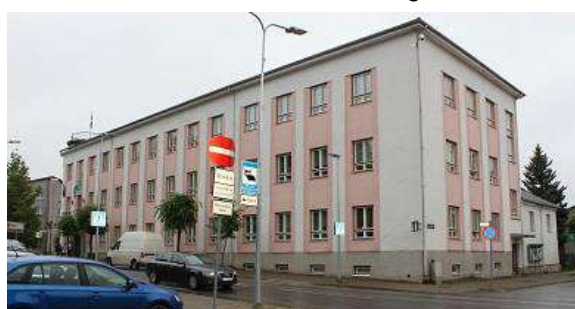
Jüri tn 12

Põllumajandusamet ja PRIA kasutavad pinda kortermajas, st hoone ja kinnistu haldamine on tulenevalt omanike rohkusest keeruline. PMA ja PRIA tööruumid on keskmises seisukorras, hoone vajab lähiaastatel investeringuid. Võrumaa Veterinaarkeskus asub linna servas, 50% vakantsusega hoones. Hoone asukohast