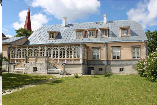
Jaani tn 10

Eraldi väikeses mereäärses hoones asub Keskkonnainspeksioon. Asutuse seisukohast ei ole kolimine vajalik, kuid see võib päevakorda tulla, kui mõnes RKASile kuulavas hoones on inspeksioonile sobilik vakantne pind. Riigimajade kontseptsiooni järgides võiksid keskkonnaasutused paikneda koos, ehk võimalusel tuleb kaaluda Keskkonnainspeksiooni kolimist Lahe tn 8 hoonesse.