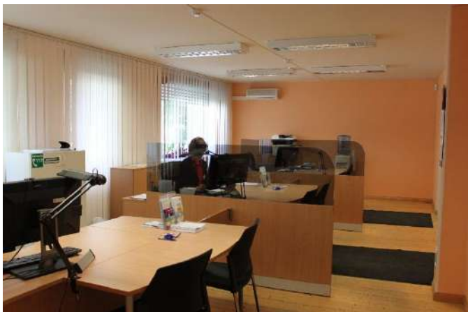
SKA teeninduslett Jõgeval

ja peredele (perehüvitised, lastekaitse jm), laste ja täiskasvanute terviseiga seotud teemad (töövõime, puue, erihoolekanne, rehabilitatsioon jt) ning ohvriabi jm.