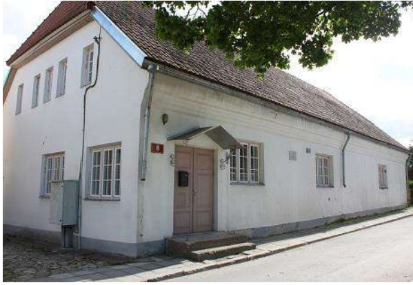
Jaani tn 8