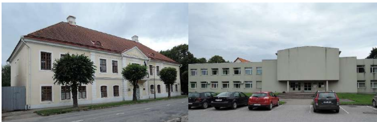
Tallinna tn 18 fassaad ja külgvaade

Riigiasutused kasutavad Paides kolme RKASile kuuluvat büroohoonet. Endine maavalitsuse hoone asub aadressil Rüütli tn 25 ning seal üürivad pinda Maa-amet, Keskkonnainspeksioon, Rahvakultuuri Keskus, Sotsiaalkindlustusamet, Muinsuskaitseamet, Nurme Kool ja Rahandusministeeriumi regionaalhalduse osakonna piirkondlik talitus. Maaeluministeeriumi asutused paiknevad Pärnu tn 58 hoones. Suurima riigimaja potentsiaaliga on Tallinna tn 18 hoone, mida kasutavad Sotsiaalkindlustusamet, Töötukassa, Maksu- ja Tolliamet, Pärnu Maakohus, Prokuratuur, Tallinna Vangla, Tööinspeksioon, eraüürnikud ning kus on piisavalt vakantsust maavalitsuse hoones asuvate riigiasutuste ümbermajutamiseks. Hoone I korruse ümber ehitamisega on võimalik tekitada kaasaegne ja mugav teeninduskeskkond.