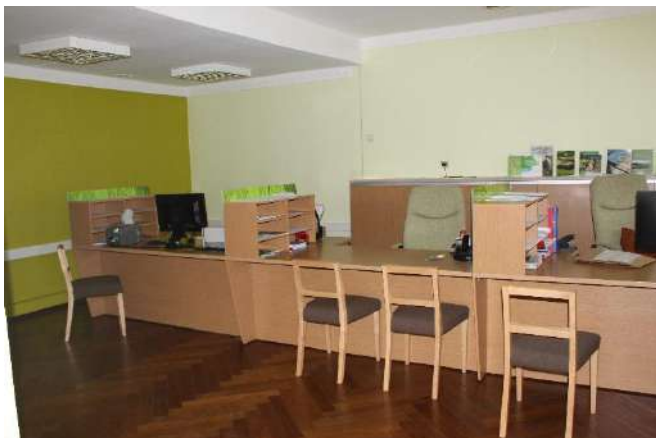
PRIA teeninduslett Kuressaares

Amet läks 2008. aastast kabinetis teenindamiselt üle teenindussaalide süsteemile. Selle põhjuseks oli kliendivajadustega arvestamine ja teeninduse kvaliteedi tõstmine. PRIA-l on enamikes büroodes letiteenindus, saalis asuvad ka kliendarvutid.