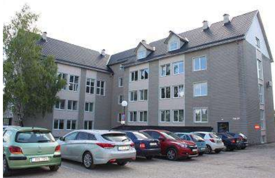
Kesk tn 20

Kesk 20 hoone on heas seisukorras, asub linna südames, kuid hoonele ligipääsetavus ning hoones liikumine on raskendatud, mistõttu vajab hoone investeeringuid. Lifti rajamine on kulukas ning hea lahenduse saavutamine ei pruugi ehitustehniliselt võimalik olla, kuna hoonel on kaks tiiba, mille korrused on erinevatel tasapindadel.