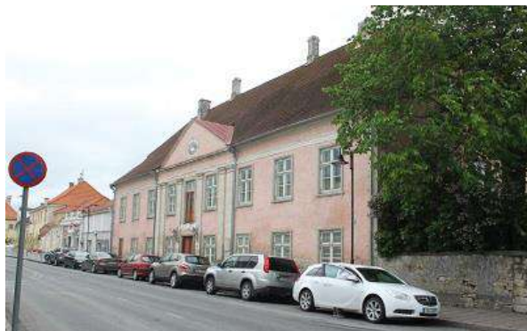
Lossi tn 7

Saare maavalitsuse hoone aadressil Lossi tn 1 võõrandati Saaremaa vallale. Riigiasutustest kasutavad hoones pinda edasi Rahvakultuuri Keskus, Riigi Tugiteenuste Keskus ning Rahandusministeeriumi regionaalhalduse osakonna piirkondlik talitus (REHO), kuid hoone baasil riigimaja rajada ei saa. Pikemas perspektiivis tuleb nimetatud asutustele leida üüripind mõnes teises hoones.