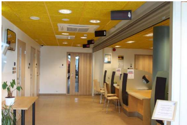
PPA teeninduslett Kuressaares

PPA arendab oma asutuse siseselt ühe akna süsteemi - näiteks toimub ühes teenindusletis nii relvaloa kui ID-kaardi taotlemine. Lisaks taotluste esitamisele soovivad inimesed saada PPA-st vastuseid ka erinevatele küsimustele ning seetõttu on võimalik saada igas teeninduspunktis ka üldnõustamist. Keerulisemate teemadega pöörduetakse suuremasse keskusesse (Tallinn, Tartu, Jõhvi, Narva, Pärnu) ja seal on rohkem erioskustega teenindajaid.