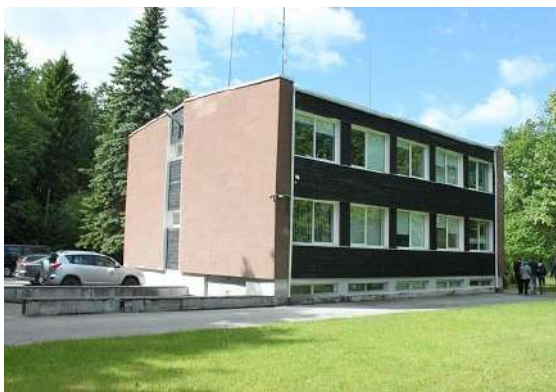
Kiltsi tee 10

Haapsalus kasutavad asutused, kelle pinnakasutuse kohta optimeerimisetepanekuid tehakse, pinda kaheksal aadressil kokku üle 3000 m 2 . Kõik need hooned on üüritava pinnaga alla 1000 m 2 , mistõttu ükski RKASi omandis olevatest hoonetest ei sobi valdkondlikuks riigimajaks.