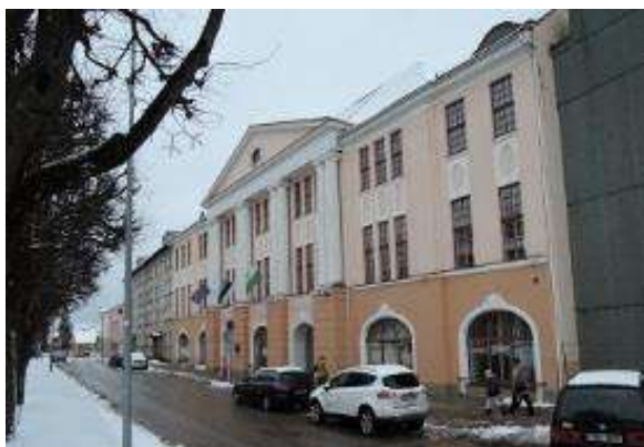
Kesk tn 12

Valgas asuvad riigiasutused viiel erineval aadressil. Hoonetest suurim, sealjuures kõige ebaefektiivsema pinnakasutusega ning suurima vakantsiga on endine maavalitsuse hoone aadressil Kesk tn 12. Kuna tegemist on esindusliku hoonega ning teistes hoonetes ei ole piisavalt vakantsust, et Kesk 12 hoonet riigiasutustest tühjaks kolida, on loogiline teha ettepanek teistes hoonetes asuvate riigiasutuste kolimiseks Kesk 12 hoonesse. Kuna hoonesse jääb pärast optimeerimissetpaneku realiseerimist endiselt vakantsus, on võimalik vaba pinda pakkuda näiteks kohalikule omavalitsusele, eraturule või vakantseks jääv hoone osa konserveerida.