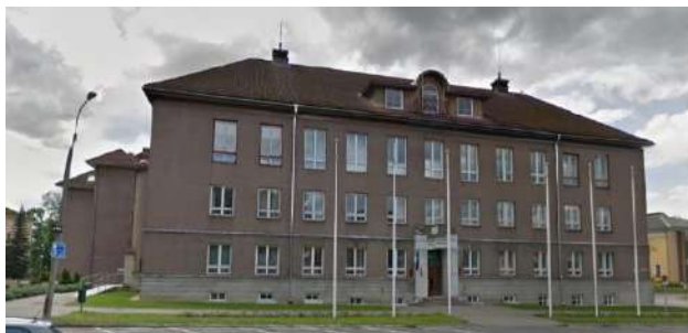
Vabaduse plats 2

Vabaduse plats 6 hoone on Viljandi linna omandis ning riigiasutused peavad hoone vabastama 2018. aasta sügiseks. Juba 2017. aasta lõpus alustati Vabaduse plats 6 hoone kasutajatele