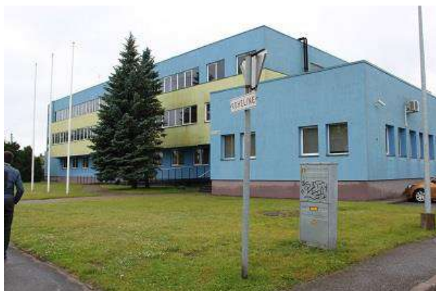
Roheline tn 64

Pärnus on asutuste koosseisud suured, mistõttu oleks ühtse riigimaja kontseptsiooni rakendamiseks vaja suuremaid hooneid kui Riigi Kinnisvara AS omandis on. Eraturg ei paku piisavas mahus sobivaid bürooruume, kuid ka uue hoone ehitus ei ole majanduslikult põhjendatud. Siiski saab olemasoleva kinnisvaraportfelli baasil teostada mõned asutuste kolimised, mille tulemusena pinnakasutus paraneb ning kõige kehvemates tingimustes olevate asutuste töötingimused paranevad.