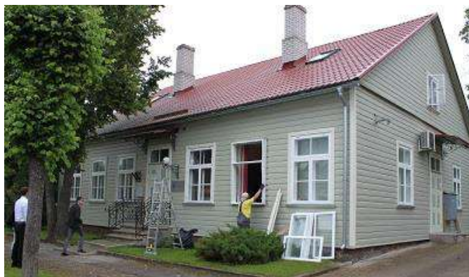
Karja tn 17a

asuvad erapinnal. Riigi kulude kokkuhoiduks on mõistlik vähendada RKASi hoonete vakantsust ning loobuda erasektori pindade kasutamisest. Seepärast tehakse ettepanek nimetatud asutuste kolimiseks Jüri tn 12 hoonesse.