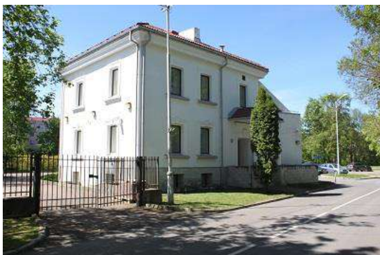
I. Grafovi tn 21

Põllumajandusamet ning Veterinaar- ja Toiduamet pakuvad Narvas vaid piiriületusega seotud teenuseid ning nende asutuste paiknemine piiripunktis on vältimatu. Piiripunktis asub ka Maksu- ja Tolliamet, kes lisaks piiriületusega seotud teenustele pakub samast asukohast teenuseid tavaklientidele. Politsei- ja Piirivalveamet pakub piiripunktis piiriületusega seotud teenuseid, kodakondsus- ja migratsioonibüroo teenuseid pakutakse uuest siseturvalisuse ühishoonest.