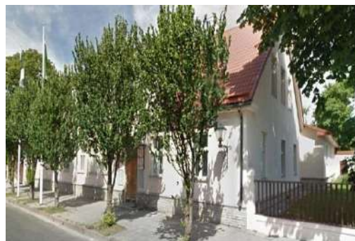
Lahe tn 8

Lahe tn 8 asuv hoone jääb pärast maavalitsuste tegevuse lõpetamist ca 75% ulatuses vakantseks. Vabaks jääv pind on piisavalt suur (ning ainus RKASi omandis olev piisavalt suur vakantne pind), et sinna kolida Keskkonnaamet. Peale Keskkonnaameti lisandumist jääb hoonesse veel arvestuslik vakants ca 20 töökoha paigutamiseks. Oma tööiseloому poolest sobivad hoonesse lisaks kõige paremini Ehte tn 9 hoones pinda üürivad asutused. Täiendavate pealinnast väljaviidavate töökohtade selgumisel (nt Tööinspektsiooni 10 töökohta) võib kaaluda nende paigutamist Lahe tn 8 hoonesse.