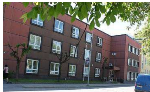
Tallinna tn 30

Probleemne on ka töö ja heaolu valdkonna riigimaja tekitamine. Sotsiaalkindlustusamet kasutab Tallinna tn 30 asuvat hoonet, mis on ebaefektiivse planeeringuga ning suure investeeringute vajadusega. Töötukassa kasutab pinda siseturvalisuse ühishoones, kuid suureneva koosseisu tõttu on vajadus suurema pinna järele. Rakvere kinnisvaraturul ei ole sobivat pinda pakkumisel olnud. Lähtudes valdkondlike riigimajade kontseptsioonist, oleks otstarbekas otsida