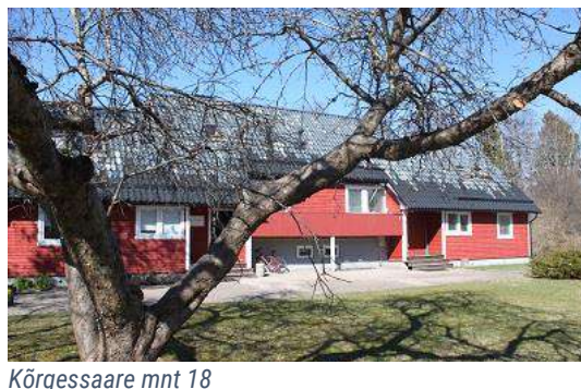
Kõrgessaare mnt 18

Keskkonnaameti pinnakasutus Kõrgessaare mnt 18 hoones on efektiivne ning nende kolimine ei ole esmavajalik. Kõrgessaare mnt 18 hoone pinnakasutust ei ole võimalik tihendada, seega ei saa sinna rajada põllumajanduse- ja keskkonna valdkonna riigimaja. Maaeluministeeriumi asutustest asub Põllumajandusamet Leigri väljak 5 hoones ning PRIA ja Hiiumaa Veterinaar keskus Käinas.