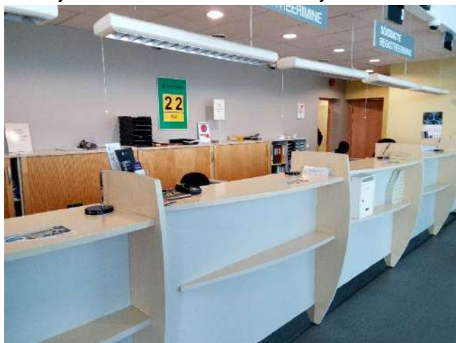
Maanteeameti teeninduslett Paides

Maanteeameti teenindusbürood asuvad igas maakonnakeskuses, samuti Narva ja Saue linnades. Maanteeamet on ühendanud ja viinud samadesse hoonetesse samas linnas asuvad teede valdkonna esindused ja liiklusregistri bürood Tallinnas, Haapsalus, Põlvas, Jõgeval. Viimase viie aasta jooksul on ühendatud bürood ja esindused ning optimeeritud pinnakasutus Jõhvis, Paides, Viljandis, Võrus ja 2018 aasta jooksul on planeeritud kolida ameti esindused ühte hoonesse Rakveres.