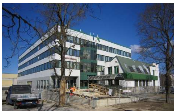
Tallinna tn 14

Hoone vakantsuse vähendamiseks on mõistlik tuua eraldi asuvad asutused maavalitsuse hoonesse. Nii tekiks üks suur riigimaja, kus oleks koos nii töö ja heaolu valdkonna