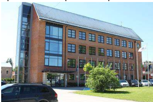
Suur tn 3

Optimeerimisetpanekutest puudutatud riigiasutused paiknevad Jõgeval neljas Riigi Kinnisvara ASile kuulavas hoones. Lisaks üürib Tööinspeksioon erasektorist ruume Aia tn 1 hoones. Suur tn 3 aadressil asuv endise maavalitsuse hoone on oma asukoha, suuruse ja seisukorra poolest kõige perspektiivikam, mistõttu on eesmärgiks seatud Aia tn 1 ja 2 (Tööinspeksioon, Maa-amet, Keskkonnainspeksioon, Keskkonnaamet, Muinsuskaitseamet), Ristiku tn 3 (Sotsiaalkindlustusamet) ja Ravila tn 10