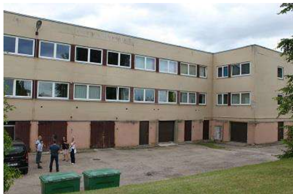
Puuri tee 1

Põllumajandus- ja keskkonnavaldkonna asutusi koondav Puuri tee 1 hoone asub kesklinnast